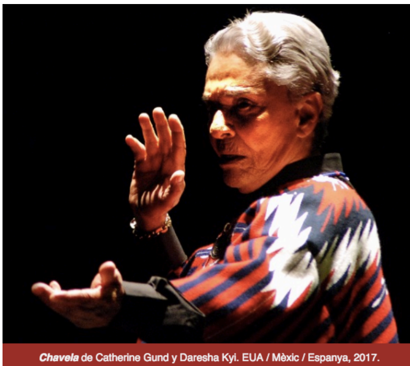
Chavela de Catherine Gund y Daresha Kyi. EUA / Mèxic / Espanya, 2017.