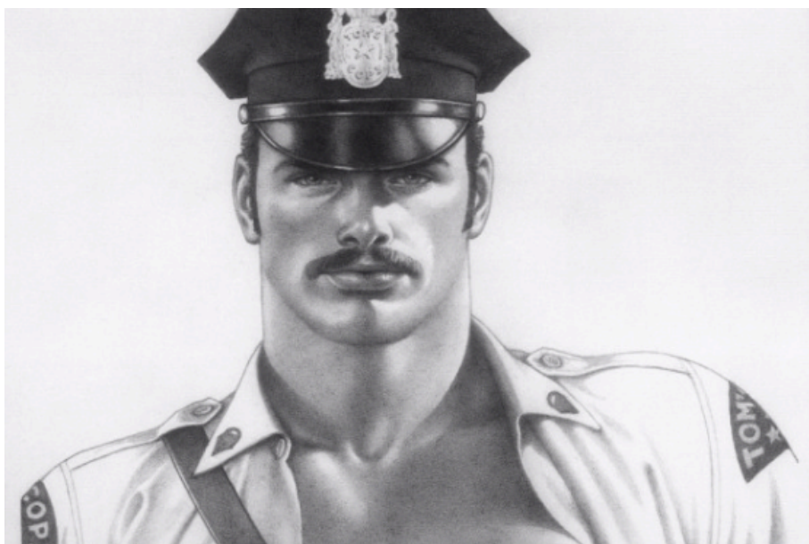
Tom of Finland de Dome Karukoski. Finlàndia, 2017.